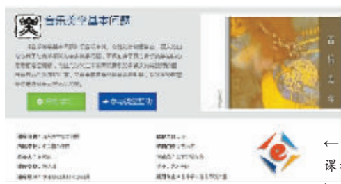
↑国家级精品资源共享课程在爱课程网(www.icourses.cn)上线。

“乘风破浪会有时，直挂云帆济沧海”，文科类教材与课程资源深度有效关联、一体化设计，数字教材、数字课程的推出，爱课程校园端直通我国千所高校，万门课程，都标志着在移动互联网时代高教文科产品与服务的新求变。