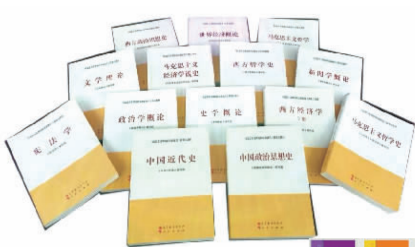
↑马克思主义理论研究和建设工程重点教材——马克思主义中国化的最新成果，体现中国特色社会主义实践的最新经验，融政治性、思想性、学术性于一体。