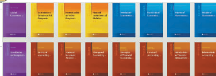
↑中国首套经济学、金融学、会计学英文原版改编教材，2014年推出新版。