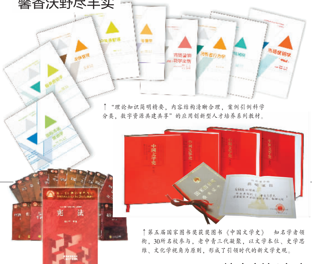
↑“理论知识简明精要，内容结构清晰合理，案例引例科学分类，数字资源共建共享”的应用创新型人才培养系列教材。