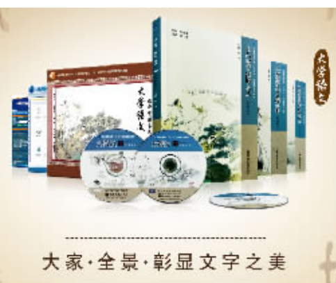
大家·全景·彰显文字之美

↑文科“面向21世纪课程教材”是“高等教育面向21世纪教学内容和课程体系改革计划”的重要成果之一，为深化文科教育改革、提高教学质量、建立我国文科优秀教材体系打下了坚实的基础。