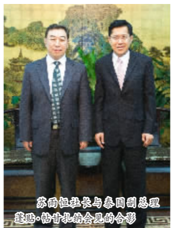
高教社社长与泰国总理蓬纳·帕纳拉翁的合影

祝愿双方可以承前启后，继往开来，共同为中国高等教育的发展继续合作。 近5年来，高教社通过翻译、影印、改编等版权授权方式引进国外优秀出版物共600余种，其中，2012年，高教社出版的《柯林斯COBUILD高级英汉双解词典（双色版）》（附CD-ROM）和《纳米结构和纳米材料——合成、性能及应用》荣获第十二届引进版社科类优秀图书奖。高教社积极引进国外优质教育资源和前沿信息，引进版教材在全国高校教育教学改革与发展中发挥了重要作用。