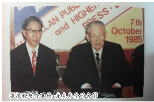
祖振铨与哈罗德·麦克米伦的合影

用给予了高度评价。泰国国家领导人的来访，有望推动高教社与泰国教育部的合作迈向新的高度。2013年，高教社又与泰国职业教育委员会签订了在职业教育领域开展合作的备忘录，进一步拓展合作范围。