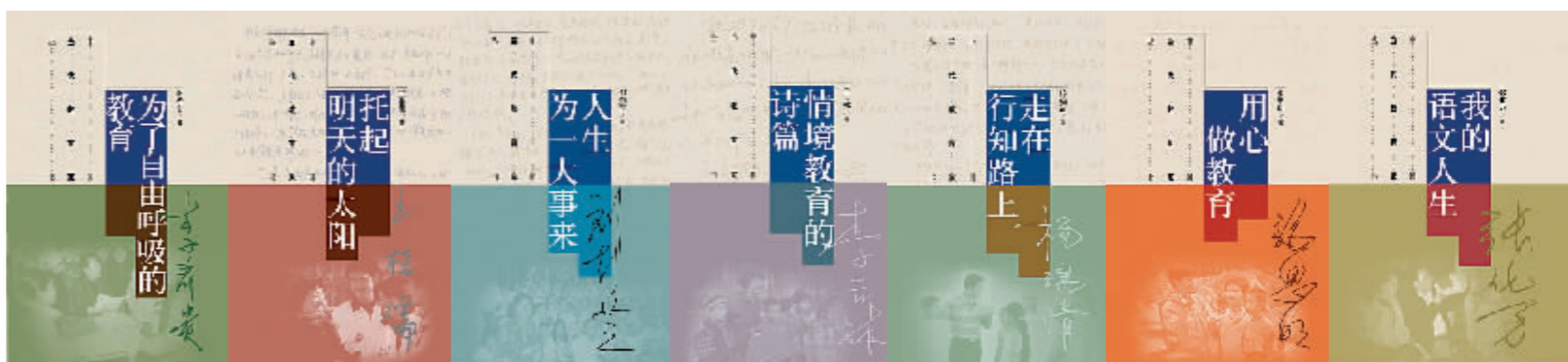
“中国当代教育家丛书”累计销售近100万册，在基础教育领域影响深远。