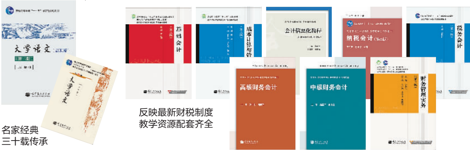
名家经典 三十载传承

2004年，高教社率先在全国出版领域实行院校代表制度，将深度经营手臂进一步延伸。截至目前，高教社已经建立了遍布全国32个省、市、自治区、直辖市的教學服務網絡，排兵布阵、跨地区经营彰显了高教社的战略眼光和改革魄力。