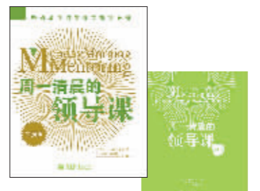
《周一清晨的领导课》作者：大卫·科特莱尔，蜚声国际的领导学顾问、教育家，该书在全世界已经销售500多万册。